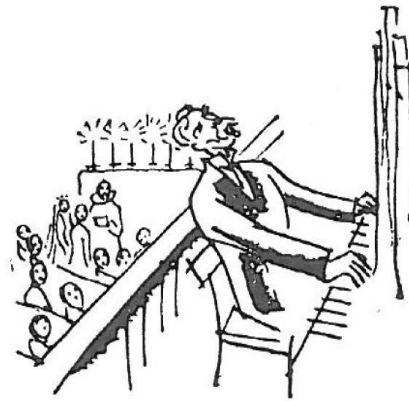
„Vil du nu bare la' Hønen gaa“

I sine senere Aar levede han ret stille paa Nørrebro i et møbleret Værelse, hvor et stort Flygel udgjorde det væsent-