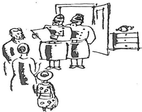
To store Betjente halede et Dokument frem og forkyndte Komponisten en Bøde paa seks Kroner

pedarvæde Position. Han fik mig nedt til at tage den den Gang drabelige Pris af 10 Kr. Timen. Følgen blev, at han vel opretholdt Prisen, men ikke fik Eleverne. Formies som han svingrede hen ad Gaden, ganske ligeglad med, hvad Folk tænkte om ham, kunde han dog nok lide at sætte sine Medmennesker paa Prøve og se, hvad de mente om ham, trods alt. Jeg erindrer en Aften, han kom i mine Forældres Hjem, just som vi Unge var ved at blive pyntet til Karneval. Efter at have beundret mig som „Aladdin“, trak han Moder til Side og spurgte, hvad hun vilde tænke om ham, hvis Politiet kom og hentede ham. Næppe havde Mor beroliget og glædet ham med sin Forsikring om, at han næppe vilde gøre sig skyldig i noget kompromitterende, før det ringede kraftigt paa Døren, og ind trådte to store Betjente, der halede et Dokument