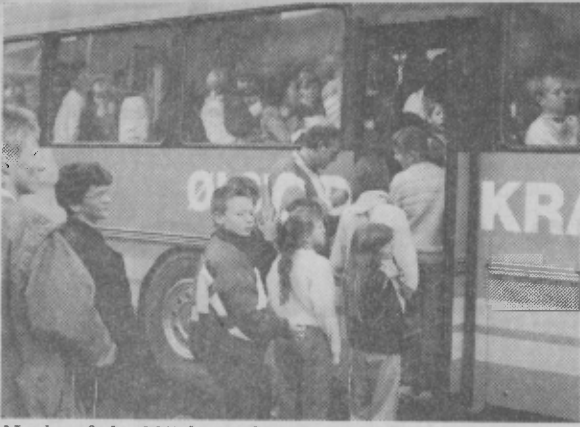
Nogle af de 295 børn fra Hedensted Skole, der satte rekord i flest børn i en bus.