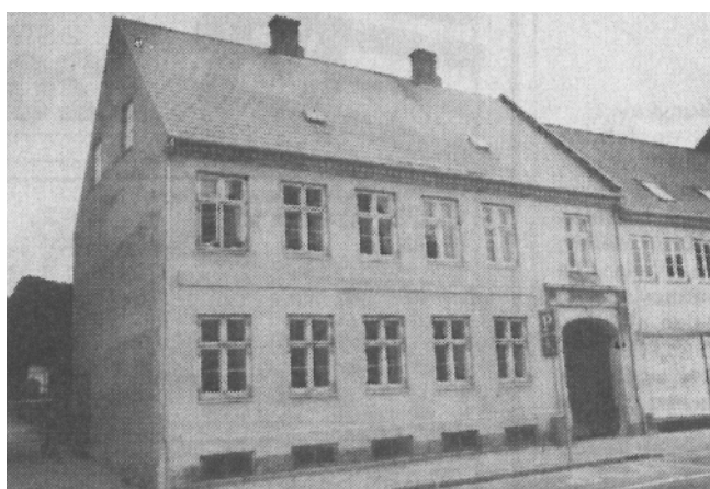
Nørregade 21 fungerer nu som en del af Skt. Ibs Skole.

Et par skøjter af okseknogle som blev brugt fra omkring