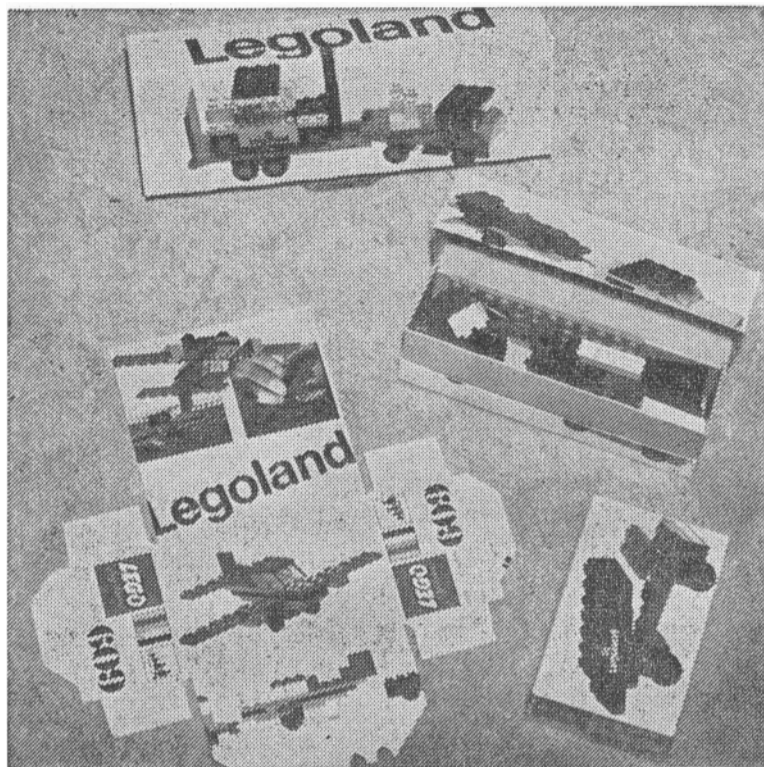
Legoland-serien blev også berømmet