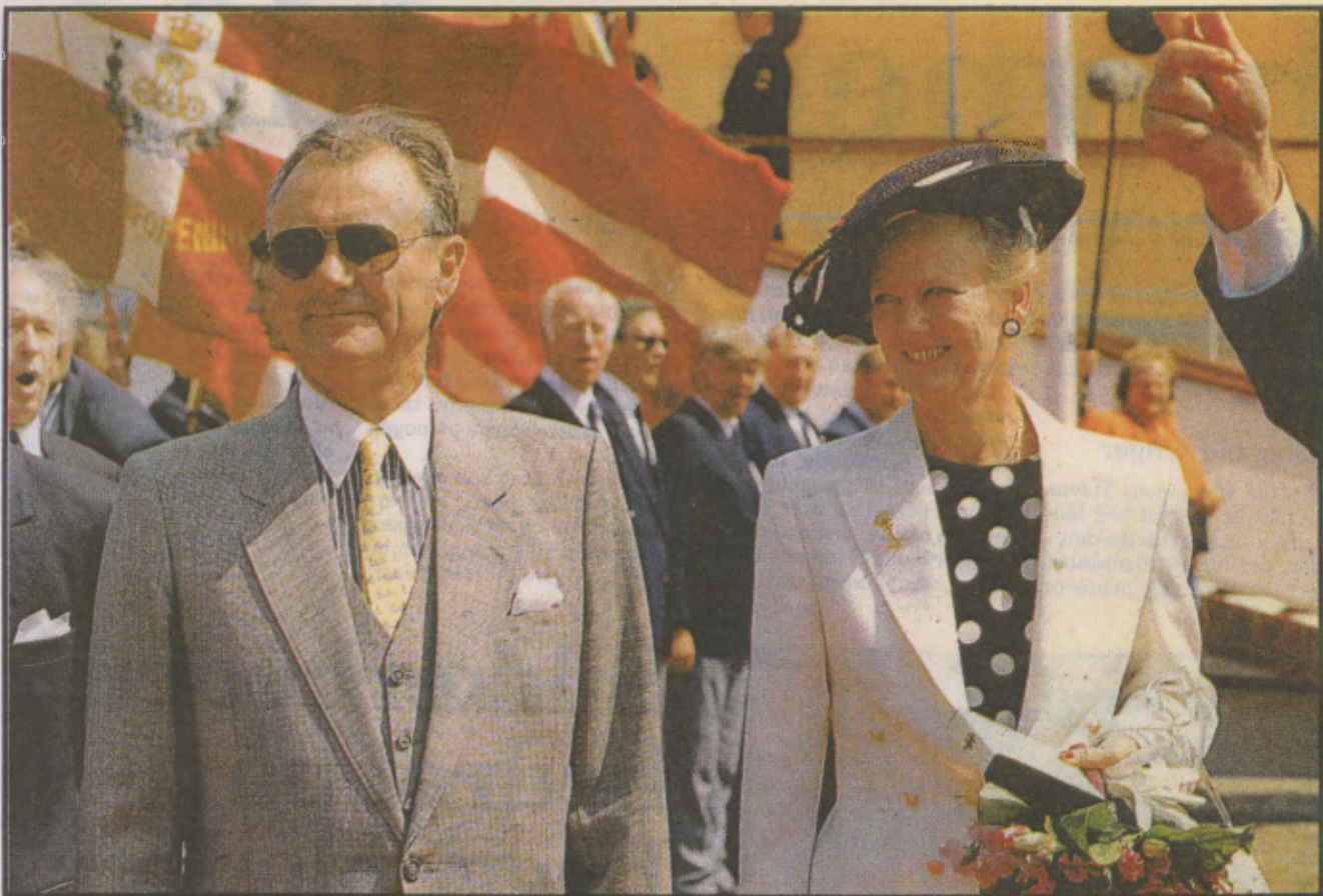
Regentparrets besøg i Horsens er planlagt ned til mindste detalje. Kl. præcis 9.00 lægger Dannebrog til kaj ved Toldboden og efter modtagelsen her er der afgang på den korte rute gennem byen kl. 9.25. Billedet viser modtagelsen af regentparret i Helsingør i sidste uge.