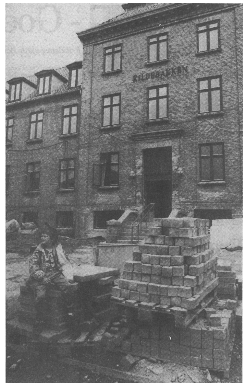
Når ombygningen på Kildebakken er færdig, vil indgangen være flyttet ned i stueplan, hvor en hall med kiosk og information tager imod gæster og beboere og leder videre til montevask, cafeteria, aktivitetslokaler og et storkøkken, der skal levere mad til såvel centrrets egne beboere som borgere i lokalområdet.

Om de tidligere beboere vil benytte sig af tilbuddet om at kunne komme tilbage er uvist, ligesom tiden må vise, om de ældre kan realisere de tanker om mere selvbestemmelse og initiativ, som ligger bag det store projekt. (birte)