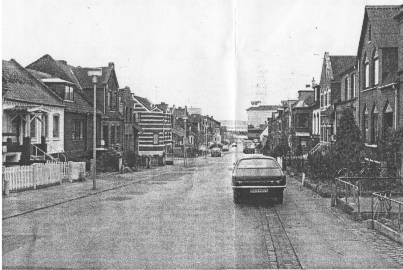
Sådan ser Ny havnegade ud i dag, fotograferet fra det samme sted som det gamle billede. Meget er der ikke forandret - og sådan vil beboerne helst have det.