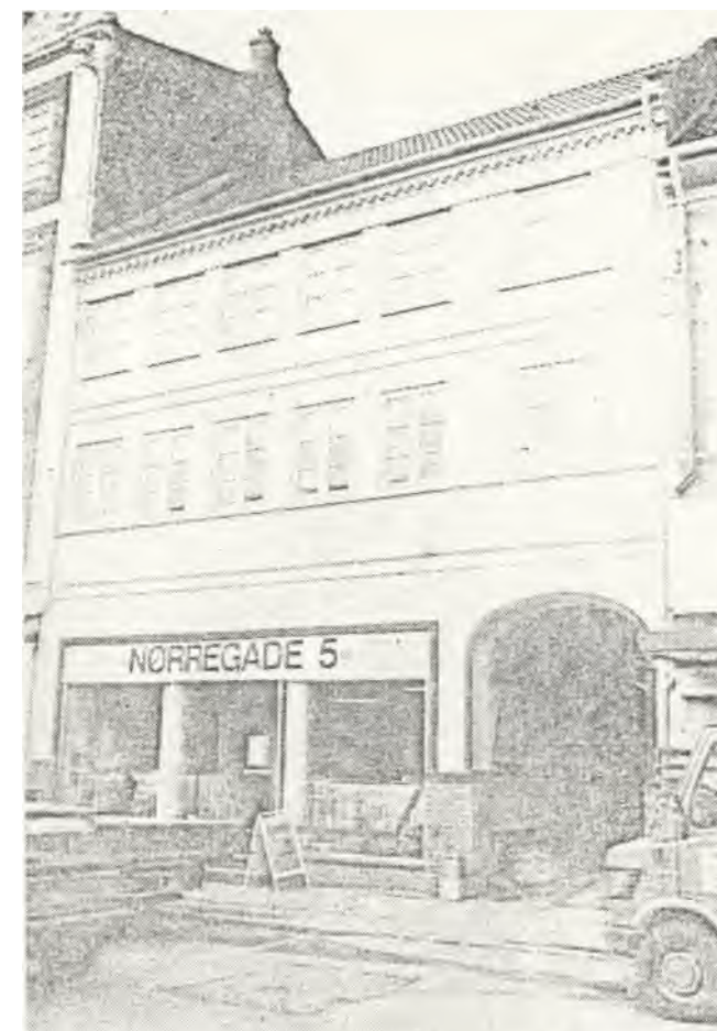
Nørregade 5 er en af de mange anonyme 1700-tals bygninger i Horsens. Læg mærke til bindingsværket, som titter frem i porten. Det var i mange tilfælde kun facaderne, som blev grundmuret og pudset.