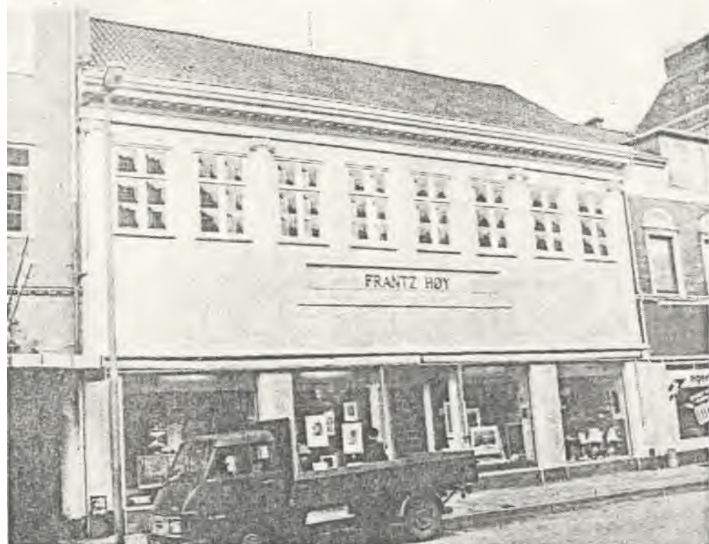
Nørregade 11, som er det første nyklassicistiske hus i Jylland. Oprindeligt har huset haft port i den østre ende og passer dermed ind i mønstret fra de andre 1700-tals huse i gaden. Karakteristisk er også pilastrene (søjlerne) på facaden, som oprindeligt har været fort helt ned til gaden.