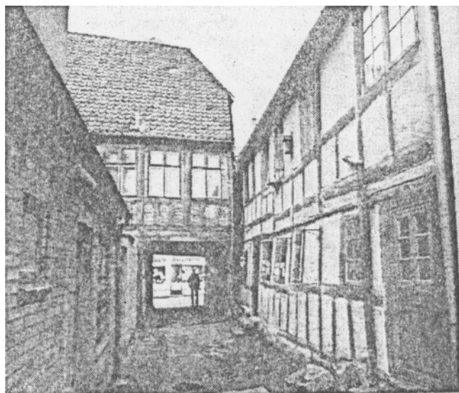
Nørregade 6, set fra gården. Længen, der strækker sig ind i gården, svarer godt til 1600-tallets byggeskik.

Længere oppe i gaden - bag Tobaksgården - kan man finde et pakhus i bindingsværk, også fra 1700-tallet, ligesom der i flere af gårdene i Nørregade er bindingsværk. Badstuestræde er også værd at kigge på, ligeledes pakhuset å hjørnet af denne gade og Aboulevarden.