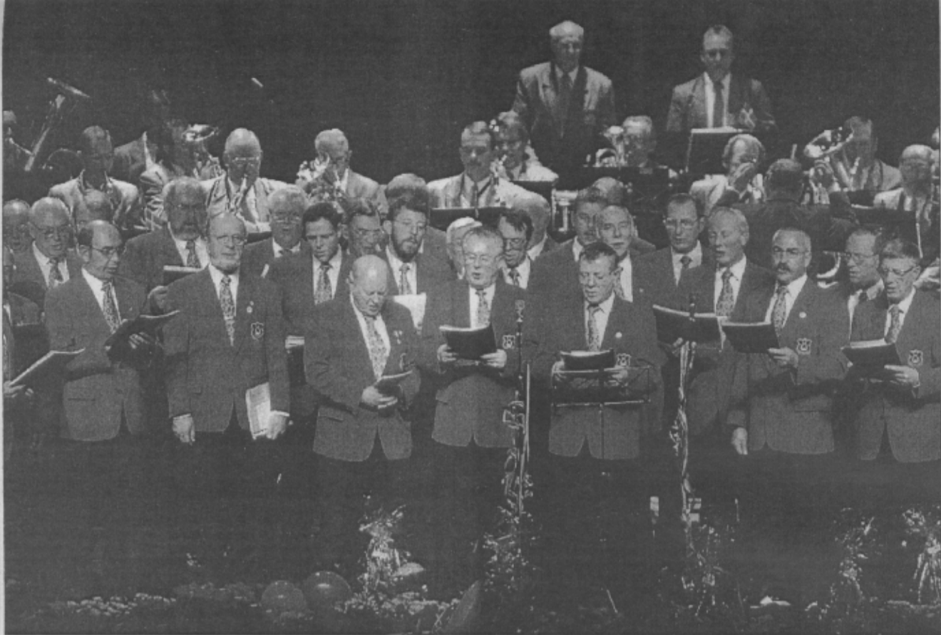
Håndværker- og Industriforeningens Sangkor og blæseorkestret „Nord for Alperne“ giver nytårskoncert Hellig Tre Kongers aften - den 6. januar 1999.