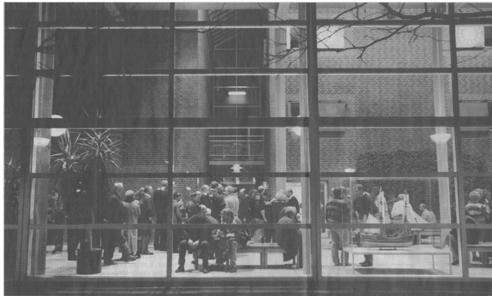
Sjældent har foredragssalen på rådhuset været så stoppet som i aftes, da der var møde for både modstandere og tilhængere af boligbyggeriet på Langelinie, hvor en gruppe private borgere vil opføre ca. 34 store ejerlejligheder.

Modstanderne fyldte mest, men ind imellem sad eller stod også tilhængere og medlemmerne af Langelinie-gruppen, der fortrinsvis er en gruppe af særdeles tunge skatteydere