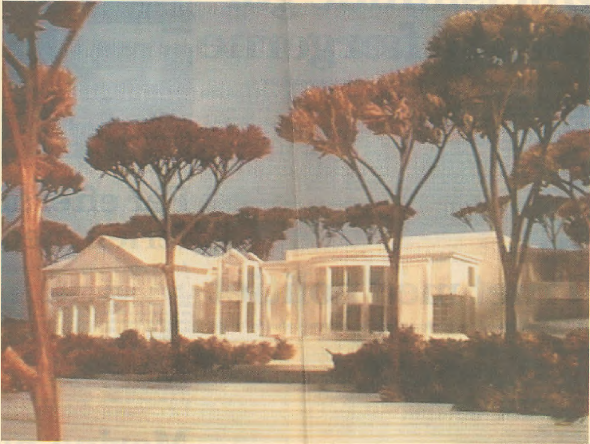
Modellen af det nye kunstmuseum illustrerer, hvordan tilbygningen følger sig sammen med den eksisterende bygning. Dette uue er set fra syd, d.v.s. fra Sundvej-siden.