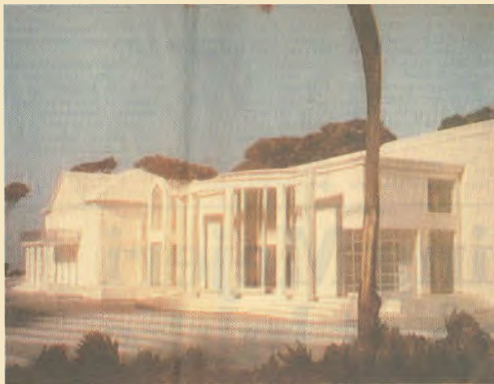
Endnu et foto af modellen, der giver et indtryk af, hvordan det færdige byggeri vil tage sig ud.

Selvfølgelig kan vi snakke om at skære ned og bygge billigere, siger Poul Schwarz.