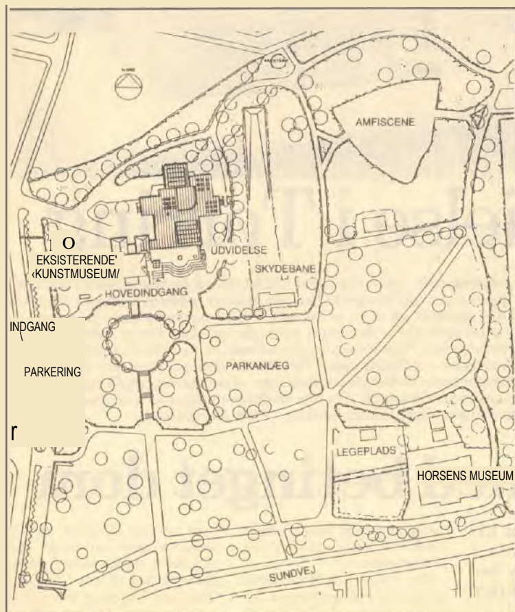
Denne plan over Lundens viser museets placering. Det areal, som inddrages til nybyggeriet, ligger i dag brak.

Nu lægger vi tegningerne frem, så horsensianerne selv kan danne sig et indtryk. (ch-r)