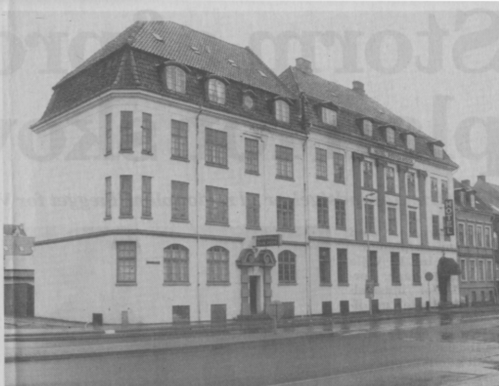
Det gamle Hotel Postgården på Gl. Jernbanegade - solgt til Højgaard og Schultz.

Efter en fusion mellem Højgaard & Schultz Vest A/S og to andre entreprenørfirmaer er han blevet koblet på projektet i Horsens. Et projekt, som har »summet« i flere år og et om-