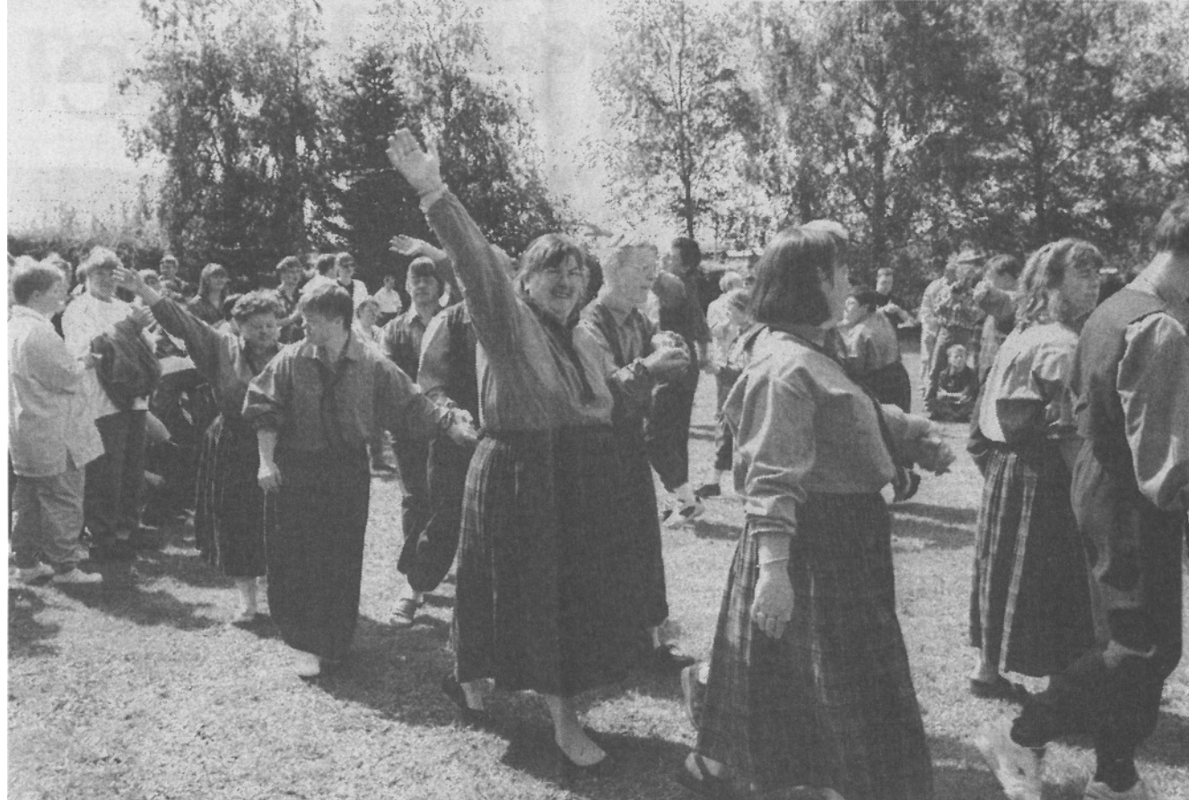
Horshøjs egne folkedansere gav opvisning med smil og humor, da den nye sansehøve blev indviet i går.