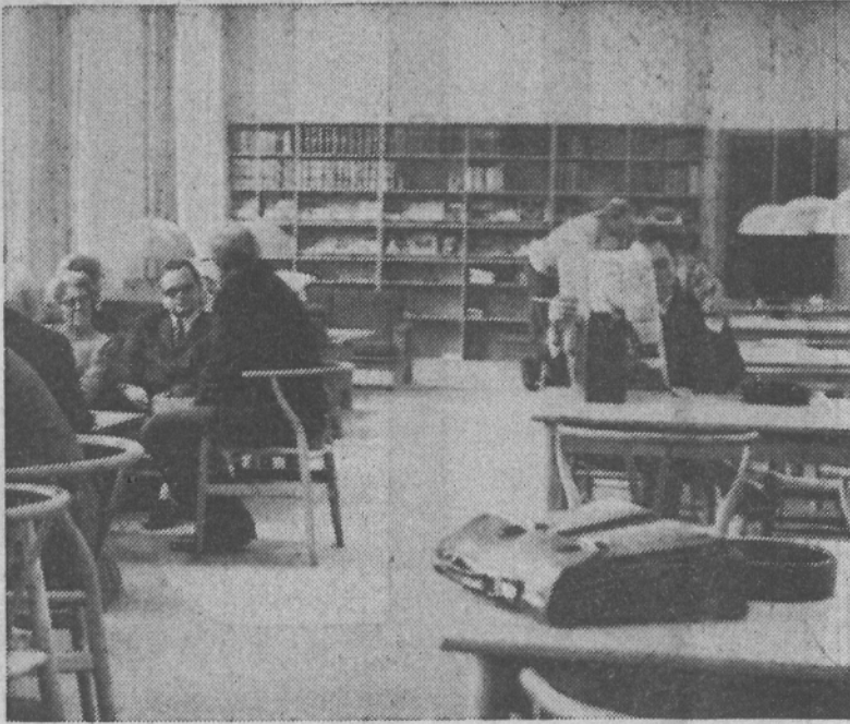
Kantinen i kælderen. Her må der godt ryges. Ellers er det forbudt på skolen. Tæpperne på gulvene kan tåle alt - blot ikke skodder.