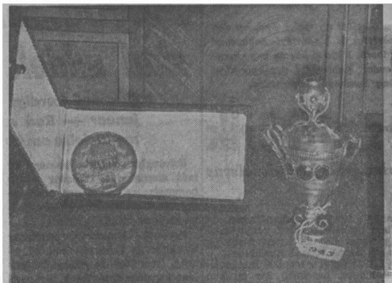
To af museets nyerhvervelser, tv. medaillen fra Den almindelige danske Landmandsforsamling i Horsens 1861 og hovedvandsægget,

Man har ogsaa erhvervet en medalje af H. Conradsen og F. Krohn for Den almindelige danske Landmandsforsamling 1861 i Horsens. En staaende Ceres-figur er afbildet paa den og desuden et firkantet skjold med Horsens' byvaaben.