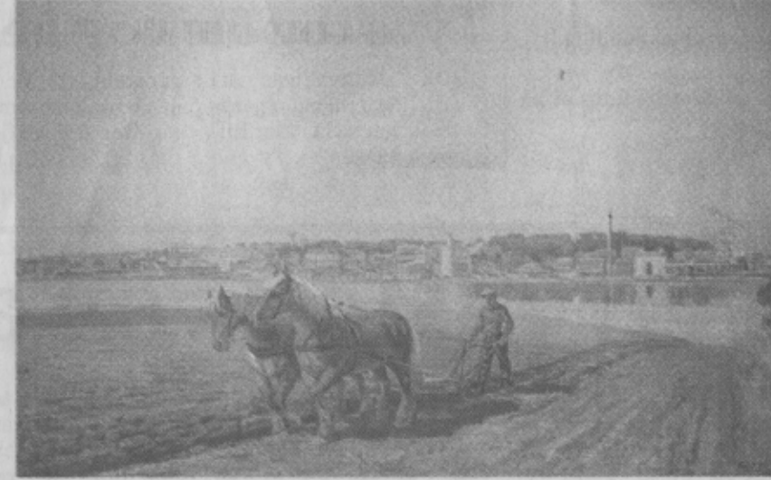
Horsens set fra fjordens sydside, malet 1951 af »Carl J. C.«.