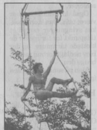
Ballet og akrobatik i en høj kran.