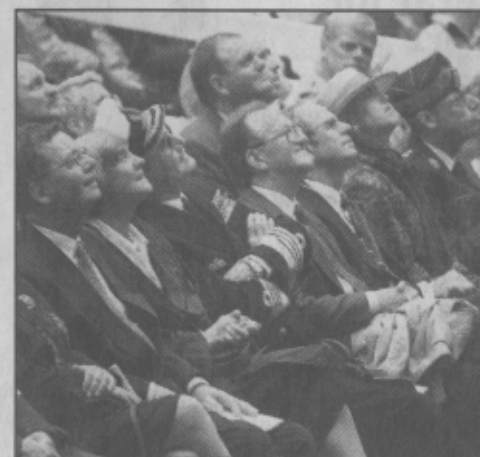
Prins Henrik og borgmestrene nød en broget buket af underholdning.