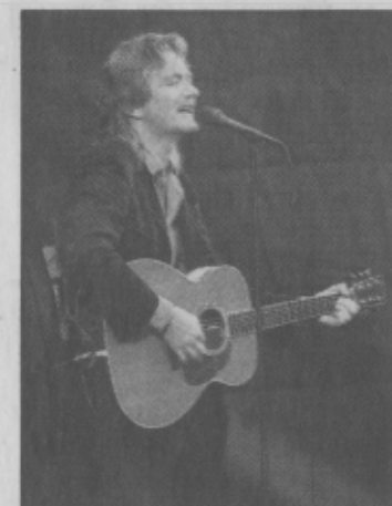
Lars Lilholt bød på fællessang.