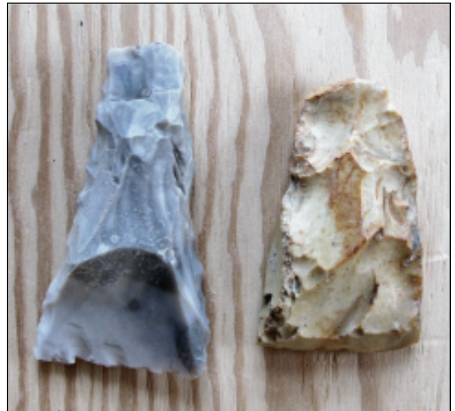
To små flintøkser fra Ertebølletiden. De er ca. 7000 år gamle. Økserne er 10 cm. og 8 cm. lange.