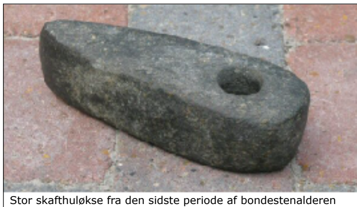
Stor skafthuløkse fra den sidste periode af bondestenalderen

Øksen er en flot, tung og solid sag. Den vejer 2.2 kg. Det virker voldsomt, især når man sammenligner med skafthullets beskedne diameter på 3,1 cm. Skafthullet er nøjagtigt udboret, med samme diameter hele vejen igennem. Man kunne gætte på, at øksen mest har tjent til at kaste glans over den høvding, der ejede den.