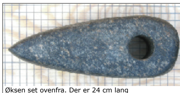
Øksen set ovenfra. Der er 24 cm lang