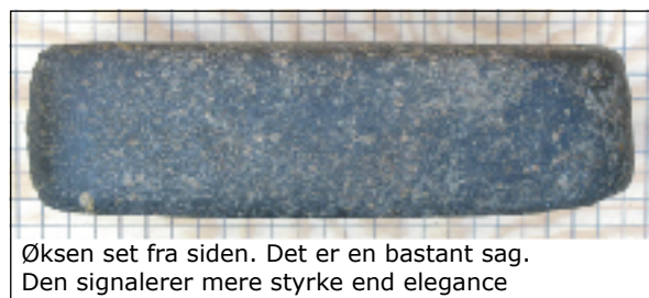
Øksen set fra siden. Det er en bastant sag. Den signalerer mere styrke end elegance