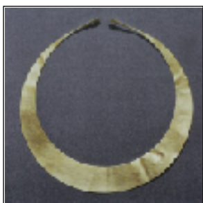
Guldhalssring fra dolktid

Og i løbet af dolktiden blev bronzeobjekter indført i stadig større mængde. De første genstande af guld kom også til Danmark i dolktiden. Så måske har en halskæde, som den på billedet, kastet glans over høvdingens hustru. Halsringen er nu ikke fundet på Endelave, den er fra Odsherred.