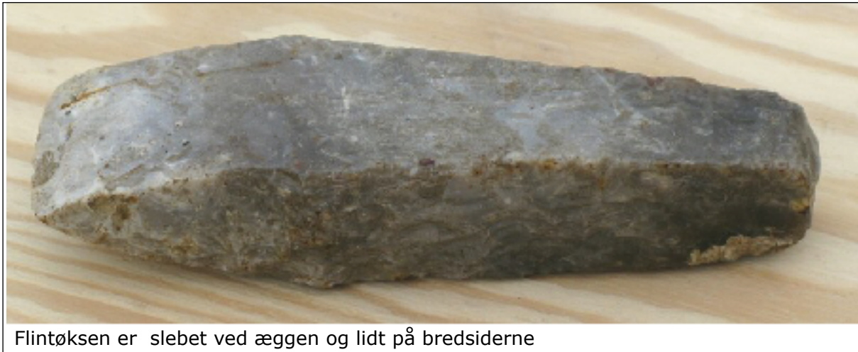
Flintøkse er slebet ved æggen og lidt på bredsiderne

Denne økse er simpel, det er en arbejdsøkse uden overflødige krummelurer. Den har været brugt til skovfældning og til fremstilling af bygningstømmer. Det kan være svært at datere en økse som denne. Den er kun slebet, hvor det er strengt nødvendigt, ved æggen og lidt på bredsiderne. Øksen er tyknakket. Dvs at den røde og den blå streg på billederne til højre er lige lange. Øksen stammer nok fra den sidste periode af tragtbægerkulturen, den tyknakkede økses tid. Med en sådan økse med skaft kunne en øvet mand fælde et 30 cm tykt bøgetræ på ca. en time. Det ved man, fordi man har lavet forsøg med det.