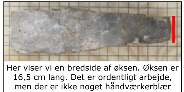
Her viser vi en bredside af øksen. Øksen er 16,5 cm lang. Det er ordentligt arbejde, men der er ikke noget håndværkerblær

Denne økse er simpel, det er en arbejdsøkse uden overflødige krummelurer. Den har været brugt til skovfældning og til fremstilling af bygningstømmer. Det kan være svært at datere en økse som denne. Den er kun slebet, hvor det er strengt nødvendigt, ved æggen og lidt på bredsiderne. Øksen er tyknakket. Dvs at den røde og den blå streg på billederne til højre er lige lange. Øksen stammer nok fra den sidste periode af tragtbægerkulturen, den tyknakkede økses tid. Med en sådan økse med skaft kunne en øvet mand fælde et 30 cm tykt bøgetræ på ca. en time. Det ved man, fordi man har lavet forsøg med det.