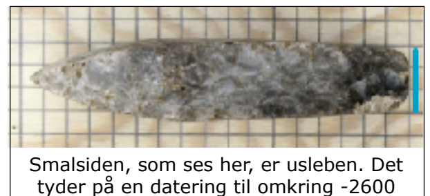
Smalsiden, som ses her, er uslebet. Det tyder på en datering til omkring -2600

Billedet nedenfor viser, hvordan huse i bondestenalderens tid kan have set ud. Det er store, velbyggede huse. Det var nødvendigt, for huset skulle rumme både folk og fæ og vinterproviant til alle. I jægerstenalderen var husene mindre, og de havde en midlertidig karakter. Det mindede mere om hytter. Tegningen er lavet efter et fund fra Bornholm, hvor man under udgravningen kunne se alle stolpehullerne. Huset har bærende stolper både i væggene og inde midt i huset. Huset er 5 meter bredt og 17 meter langt. Under udgravningen fandt man rester af lerklining. Der må have været et hul i taget til røgen fra bålet.