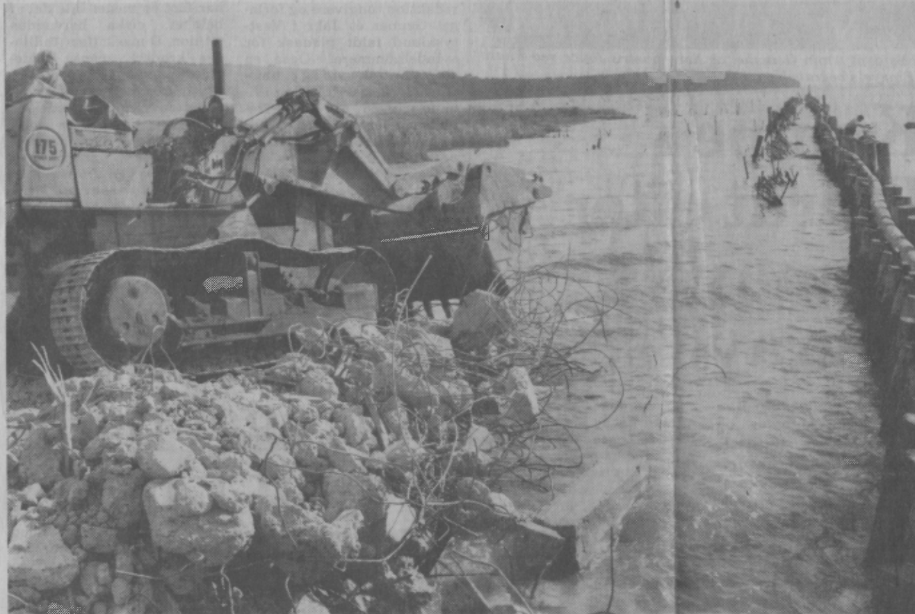
Der sættes nu en effektiv stopper for mudder- og landflugten fra det inddæmmede område ved Husodde. En vold af murbrokker lægges langs de væltede fasciner og herfra fyldes hele området op.

HORSENS - Horsens Dampmølle på hjørnet af Møllegade og Borgmesterbakken ender i Horsens Fjord.