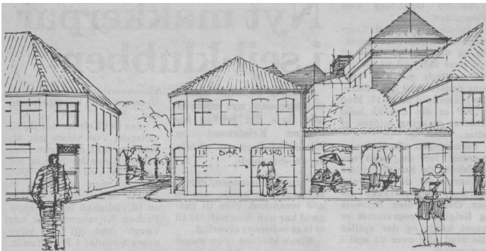
De tre ejendomme nord for Farvergades udmunding i Smedegade forudsættes nedrevet - skitsen viser, hvad der kan skabes i stedet med nye ejendomme i gammel stil og med en arkade, der giver adgang til det ombyggede tobaksfabrik-kompleks

Derefter kan bolig- og butiksbyggeriet langs den nye gade og ved Gl. Jernbanegade ventes indledt i foråret 1986. Grunden til dette byggeri er allerede ryddet, og bag den nye husrække skabes nye grønne områder og stiforbindelser til erstatning for den sydligste del af Houmannsgade, som helt forsvinder af bykortet. (Jefler)