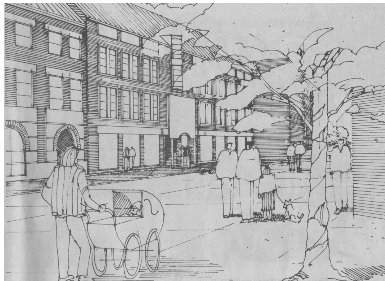
Set fra indgangen til det nye rådhus kommer den nye butiksbbygning til at tage sig sådan ud mellem SDS-huset til venstre og HK/Horsens Sparekasse til højre. Med på tegningen er en del af den kommunale udsmykning med fontæner og platantræer på det kommende rådhusstrøg

- Vi tror, dette byggeri vil klæde den store genbo mod syd, siger Mogens Svenning. (Jef fer)