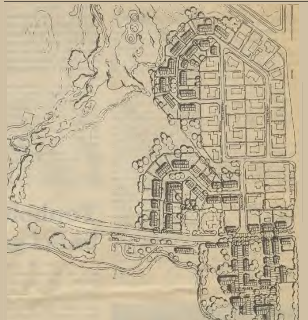
Her er den ene af skitserne til afrunding af byggeriet ved Teglvangen, et torveområde ved Lovbyvejs udmunding i Schüttesvej og hotel eller kursusbygninger på Teglværksgrunden.

Foreløbig er der tale om forslag, men alt sammen kan det blive virkelighed over en årrække, og projektet skal såmænd nok komme til at præge partiernes valgprogrammer om et lille årstid.