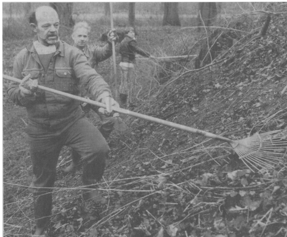
Lokale folk er i gang med at rense op på »bjergtet«, hvor 600 år gamle urter vil dukke frem.

Det siger sig selv, at attraktionen også vil få turistmæssig betydning, fordi der er tale om noget væsentligt fra 1300-tallet. Erik Menveds borg har haft stor