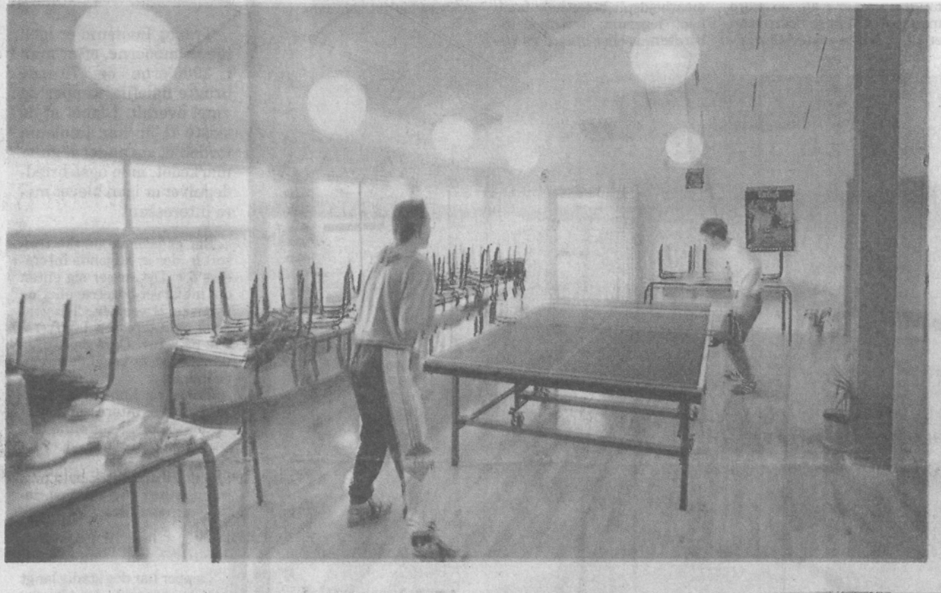
Fælleshuset på 400 kvm. hænger arkitektonisk sammen med de lave boligblokke.

Boligforbedringerne tager altså hensyn til bade naturens ressourcer og beboernes nomi. Men det er ikke kun naturens miljø der tilgodeses. Opførelsen af et 390 kvm. stort fælleshus er et væsentligt led i »projekt Det ny Axelborg«<. Det er intentionen, at fælleshuset ikke skal være et gildehus, men et dagligt trivselshus, hvor beboere i alle aldre modes over fælles interesser.