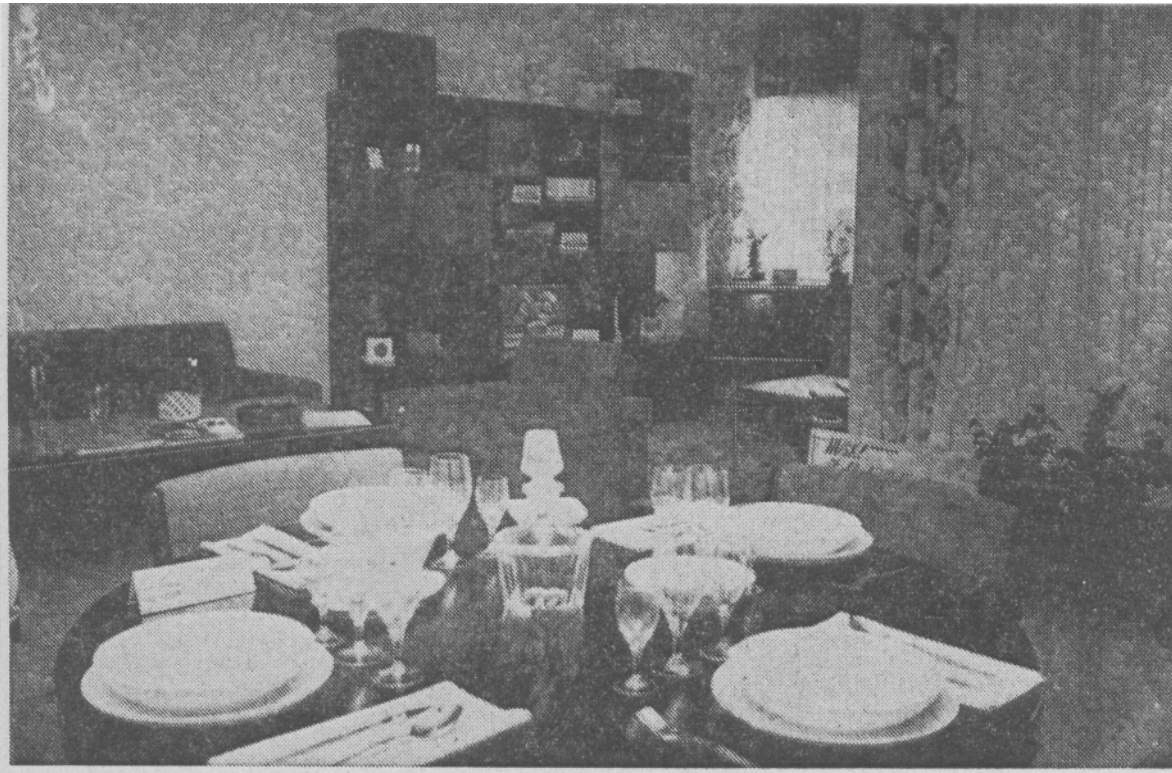
Et udsnit af den rummelige vinkelstue i udstillingslejligheden

Forste otte lejligheder klar til indflytning 12. marts