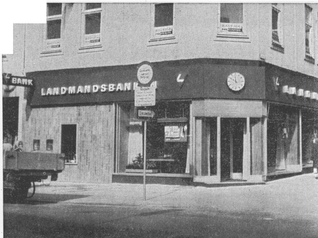
Den ny afdeling af Landmandsbanken i Horsens, der åbnede i dag

Banken er indrettet i et 150 kvadratmeter stort ekspeditionslokale. Her som overalt i den nye afdeling er gulvene belagt med tæpper, hvis røde og olivengrønne farver er tilpasset lokalets lyse egetræsinventar. Bag en elleve meter lang ekspeditionsdisk findes to kasser (og mulighed for endnu eon) samt plads til syv medarbejdere. Der er indrettet et taleværelse samt et direktørkontor. På kundearealet har man udover skrivepulte og siddepladser ind-