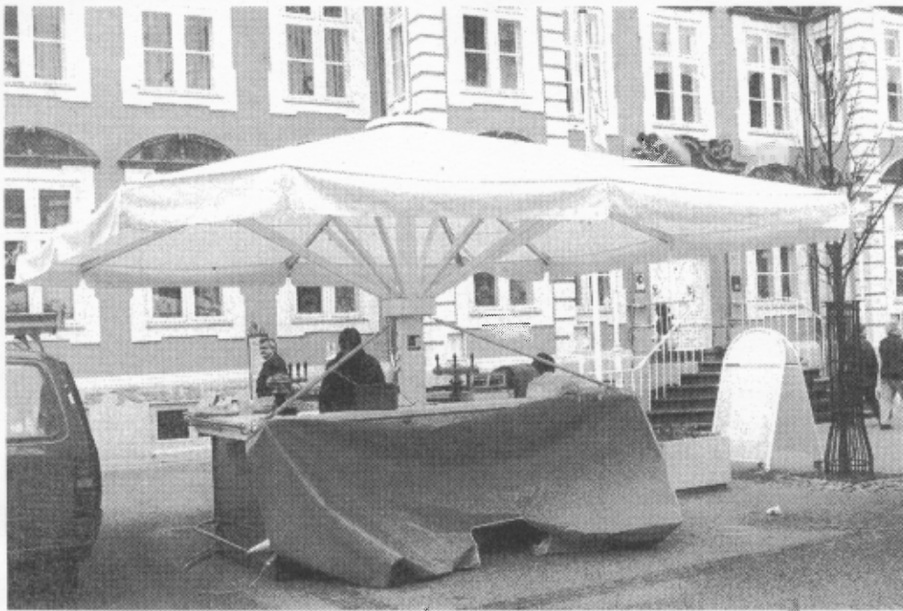
Danmarks største parasol er 29½ kvadratmeter og placeret på Søndergade. Det er Eydes Kælder, der i dag åbner en udendørs bar.