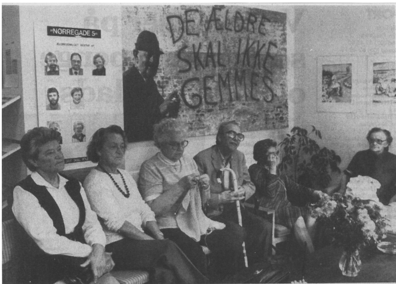
Ældrebutikkens bomærke var på flere måder baggrund for en debat om, hvorvidt de ældre skulle præsenteres på denne måde. En del mente, at det ikke var godt, at blive slået i hartkorn med de unge hærværksfolk på denne måde.