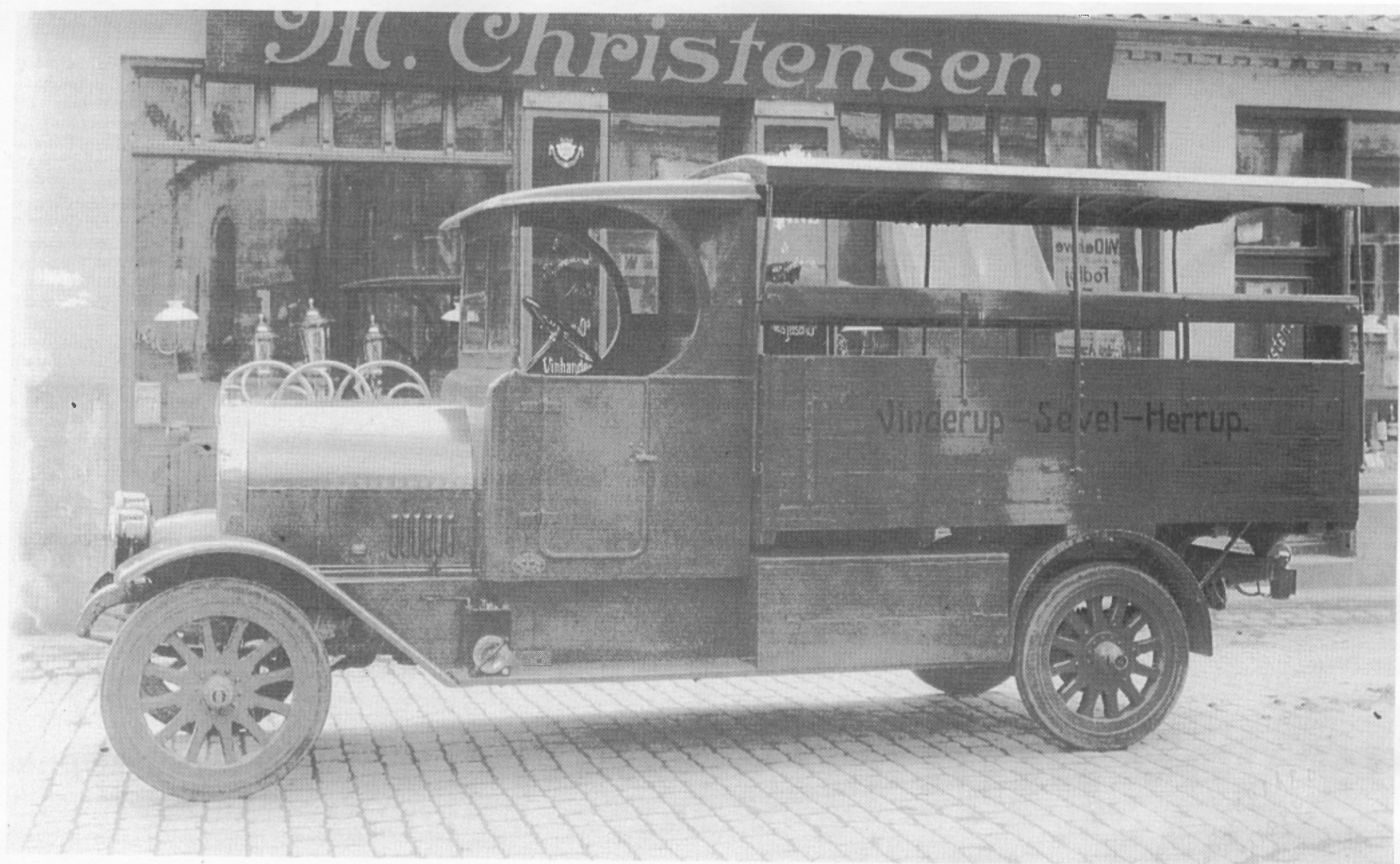
En af de sidste Gideon-modeller blev denne to tons landpostvogn med klapsæder og aftageligt tag fra 1921.